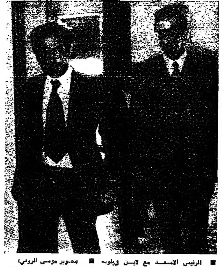
الرئيس الاسعد مع لاسين في بلونه

وصول قوات الردع إلى الحدود شرق من أنستال أثر مما يحل. والخيار الطبيعي والوحيد الباقي هو اعداد قوة رسمية لبنانية لحمة محددة في الجنوب. لكن الصعاب في وجه هذه القوة ليست مجرد مصاعب إسرائيلية أو مصاعب فلسطينية، بل هي مصاعب لبنانية. فلا يمكن تشكيل هذه القوة اذا لم تكن صورة مصفرة من الصيغة اللبنانية الجديدة. وهكذا تعود إلى نقطة البداية إلى الاتفاق السياسي، والتي التوازن اللبناني في الداخل والخارج، فالطول الجزيئية لا تقودنا إلى الاتفاق السياسي لكن الاتفاق يفتح الأبواب أمام كل المحلول. وفي انتظار ذلك، تبقى الفرصة مفتوحة أمام تصفير الاضرار في الجنوب، وإياد كبر السور الدبلوماسي اللبناني. رفيق خوري